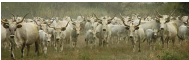
Maremma-kveg, et Presidium fra Toscana