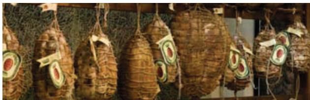
Culatello di Zibello, et Presidium fra Emilia-Romagna

Hvert år lages det 30.000 Culatello di Zibello (spekekjøtt fra Emilia-Romagna) med DOP-merke (beskyttet opprinnelsesbetegnelse). Av disse er det bare 7.000 som er håndlaget og modnet uten kjøling av produsenter godkjent av Slow Food-presidiet. I England er det 14 produsenter som lager West Country Farmhouse Cheddar med PDO-godkjenning. Bare tre produsenter oppfyller de strengere kvalitetskravene til Slow Foods presidium for Somerset Cheddar.